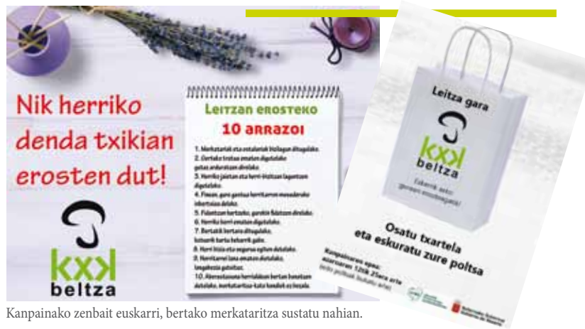
Kanpainako zenbait euskarri, bertako merkataritza sustatu nahian.

LEITZAKO KAXKABELTZA MERKATARI ELKARTEAK HERRIKO MERKATARITZA SUSTATZEKO ETA MERKATARITZAN EUSKARA ERE KONTUAN HARTZEKO KANPAINA ABIARAZI ZUEN AZAROAN, UEMAREN ETA NAFARROAKO GOBERNUAREN LAGUNTZAREKIN. KANPAINA HONEKIN, HERRIKO DENDETAN EROSTEA HERRIARI BIZIRIK EUSTEKO ETA HERRIA GARATZEKO ZEIN GARRANTZITSUA DEN NABARMENDU NAHI DUTE LEITZAKO MERKATARIK. MERKATARITZA EUSKALDUNTZEKO ETA UDALERRI EUSKALDUNAK GARATZEKO UEMAREN ILDOEKIN BAT EGITEN DUENEZ KANPAINAK, UEMAREN LAGUNTZA ERE IZAN DU KAXKABELTZA ELKARTEAK.