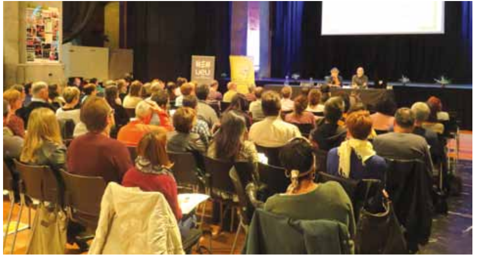
UEMAK, Gipuzkoako Foru Aldundiak, Euskararen Gizarte Erakundearen Kontseiluak, Udako Euskal Unibertsitateak, Azpeitiko Udalak, Gaindegiak antolatuta zuten egun osoko jardunaldia, eta ehun bat lagun elkartuta zen egun osoan hitzaldiak eta mahai-inguruak bertatik bertara jarraituz.

UNIBERTSITATEKO ARKITEKTURA IRAKASLEAK, TURISMO ALORREKO TEKNIKARIAK, ERAKUNDE PUBLIKOETAKO ORDEZKARIAK, EUSKALGINTZAKO ERAGILEAK ETA BESTE HAINBAT ALORRETAKO ADITUAK ETA PROFESIONALAK ELKARTU ZIREN URRIAREN 10ean, AZPEITIAN, ‘LURRALDEA ETA HIZKUNTZA: ARNASGUNEEN PREBENTZIOTIK GARAPENERA’ JARDUNALDIAN. EUSKARAREN ARNASGUNEEN IZAERARI EUSTEKO MODU BAKARRA UDALERRI EUSKALDUNAK BENETAN GARATZEA DELA NABARMENDU ZUTEN ONDORIOETAN, ETA HORRETAGAKO HAINBAT PROPOSAMEN ZEHATZU ZITUZTEN ANTOLATZAILEEK.