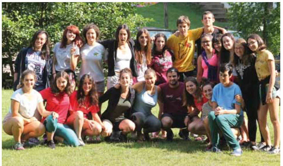
Uztailean Zestoako Sastarrain aterpetxean astebeteko egonaldia egin zuten Udalerrri Euskaldunetako Gazteen Udalekuean lehen aldiz parte hartu zuten lagunek. Datorren ekainean ibiltaria izango da astebeteko topaketa.

Proiektua bere osotasunean garatzeko, eta hezkuntza arautuaren mugak gainditu nahian, lehen aldiz Salto Gazte Topaketak antolatu zituen UEMAK iaz. Udalerrri euskaldunetako gazteek elkar ezagutzea eta beraien artean euskara oinarri hartuta saretzea zen asmoa. Lehen deialdi hark izan zuen erantzun ederra ikusita, pasa den uztailean Udalerrri Euskaldunetako Gazteen Udalekuak antolatu zituen lehen aldiz UEMAK.