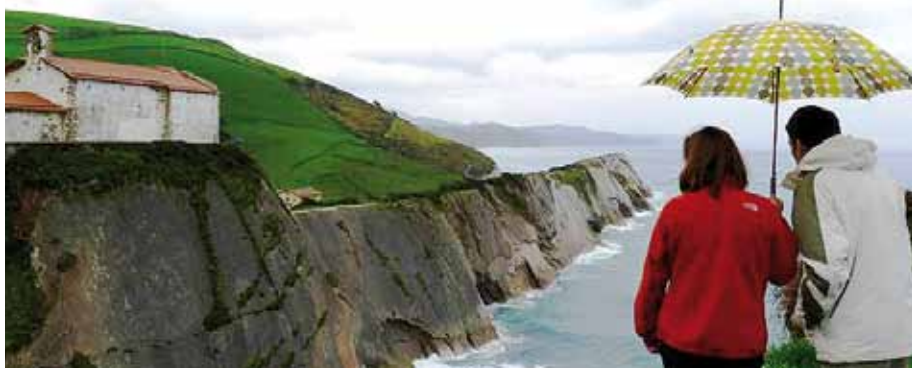
Zumaia, Bermeo eta Leitzaldean erantzun dituzte bisitariak galdetegiak, eta antzeko joerak agertu dira erantzun gehienetan: bisitarien %85ek eskertu egiten du euskarazko ikustea edo euskara entzutea.

TURISMOAK GORA EGIN DUEN HAINBAT UDALERRI EUSKALDUNETAN, BISITARIEK EUSKARAREKIKO DUTEN IKUSPEGIA AZTERTU DU UEMAK, INKESTEN BIDEZ. JASOTAKO ERANTZUNETAN JOERA ARGIA IKUSTEN DA: BISITARI IA GUZTIEK ESKERTU EGITEN DUTE EUSKARA IKUSTEA EDO ENTZUTEA, ETA ASKOK BERARIAZ HAUTATZEN DU UDALERRI EUSKALDUNETARA ETORTZEA, EUSKARAREKIN TOPO EGITEKO. BISITARIREN LAURDEN BAT EUSKAL HERRITIK DATOR, ETA BESTE LAURDEN BAT HERRIALDE KATALANETATIK.